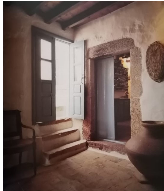
Μ.Φωτιάδης, κατοικία στα Τρία, Χώρα Πάτμου

Οι Κυκλάδες συγκεντρώνουν την πλουσιότερη συλλογή παραδειγμάτων επανάχρησης, παρ' όλα αυτά δύσκολα ανιχνεύονται πρωτότυπες δημιουργίες. Πιθανή εξαίρεση μοιάζει να είναι η μετατροπή ενός μονώροφου εξοχικού σπιτιού επάνω σε σχιστό βάθρο από λιθοδομή στο Επισκοπείο της Σύρου (1892) σε διώροφη κατοικία από τον αρχιτέκτονα Αναστάσιο Κάρτα.