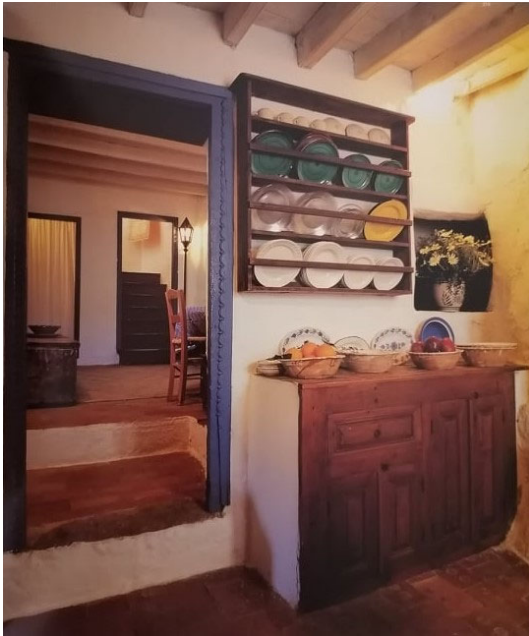
Μ.Φωτιάδης, κατοικία του αρχιτέκτονα στη Μεγάλη Παναγιά, Χώρα Πάτμου