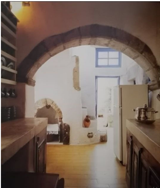
Μ.Φωτιάδης, κατοικία στους Μύλους, Χώρα Πάτμου