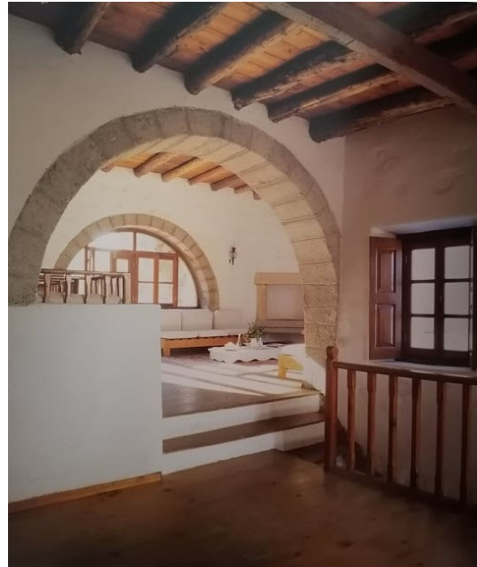
Μ.Φωτιάδης, διπλοκατοικία στου Οικονόμου, Χώρα Πάτμου